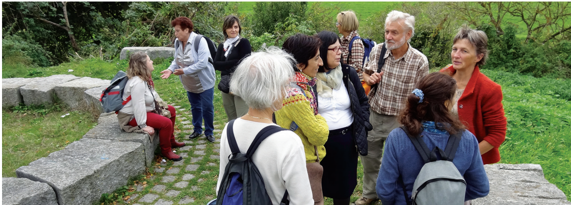
Voyage et visite écoquartier, Freiburg (DE), 6 octobre 2012