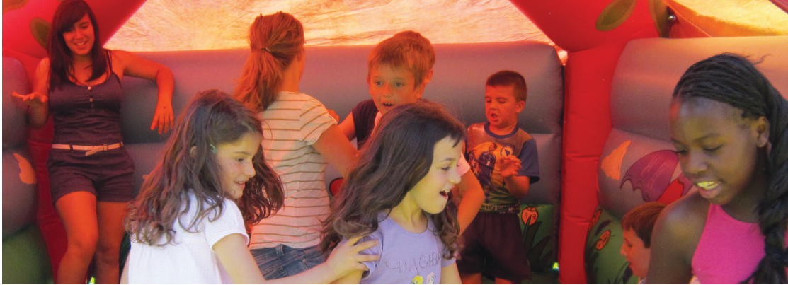
Fête de quartier, 16 juin 2012